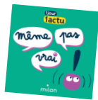
Illustration : Jacques Azam.

Retrouve tous les épisodes de Même pas vrai! sur ljournalactu.com