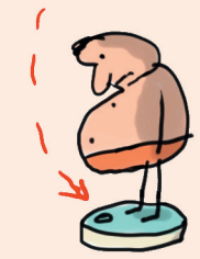
Illustration : Jacques Azam.